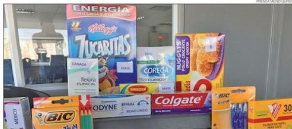
IMPORTACIONES. El autor denuncia que hay todo tipo de productos desde el exterior.

pices de Francia, pasta dental del Reino Unido, pollo elaborado de Brasil. Los números macro lo confirman: en 2016, las importaciones crecieron en cantidades un 5%, pero las importaciones de bienes de consumo alcanzaron un 17%. Importamos trabajo extranjero y destruimos empleo argentino. El contraefecto de lo que vemos en la caja negra es lo que pasa con la especulación financiera. El contexto que genera la política económica del Gobierno es ideal para capitales que ingresan al país para especular con la bicicleta financiera en lugar de producir. El nuevo aumento de la tasa de interés por parte del BCRA esta semana no hace más que mandar otra señal en el sentido equivocado y desalentar a las pymes. El orgullo es el peor de los pecados capitales que la conducción económica puede cometer. La caja negra muestra a todas luces el resultado de esos errores, los compila. Comprenderlos y modificar la conducta es la clave para no ser espectadores de un nuevo fracaso. En aquella película, Brad Pitt no pudo comprenderlo a tiempo. ¿Nosotros podremos? ■