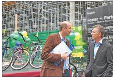
ICONO. La "bicicleta" de Sturzenegger y Macri hoy está de moda.

Más sobre el BCRA en el análisis de la pág. 28. ➔