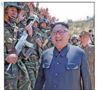
Kim Jong-Un promete no tener piedad.