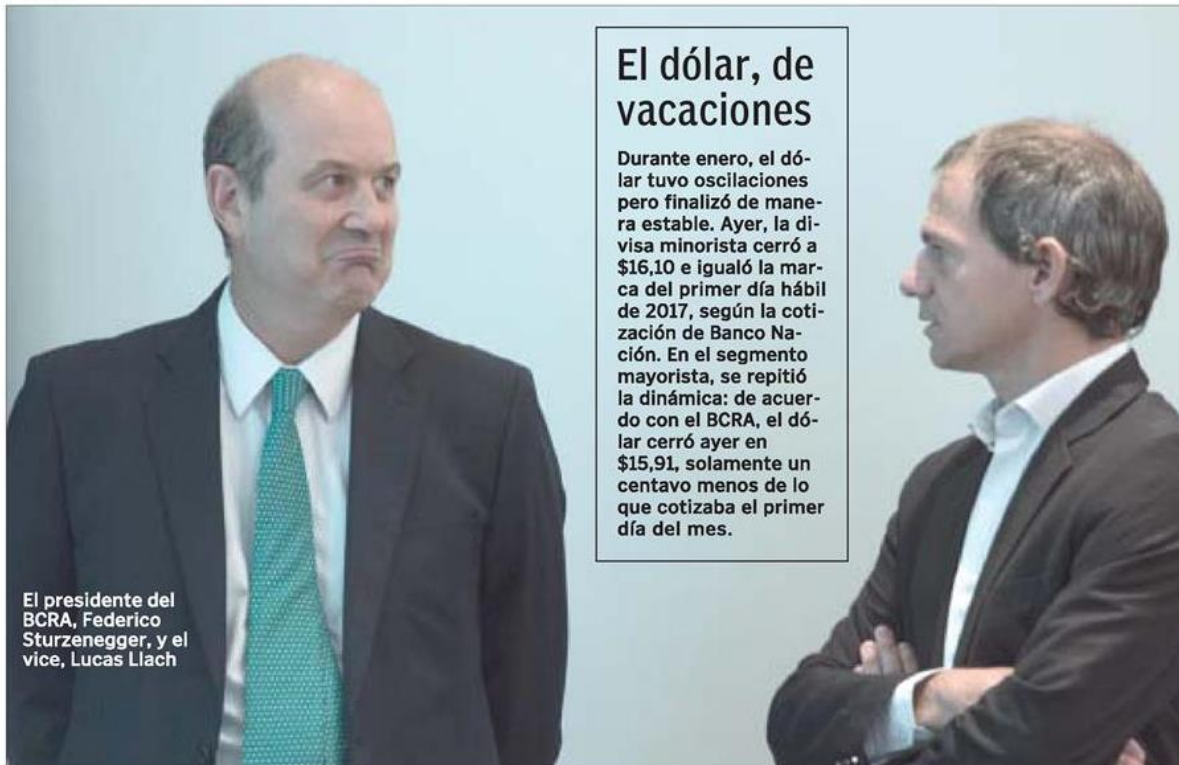
El presidente del BCRA, Federico Sturzenegger, y el vice, Lucas Llach

La mayoría no tiene más de u$s 20.000, que podría ser blanqueado a costo